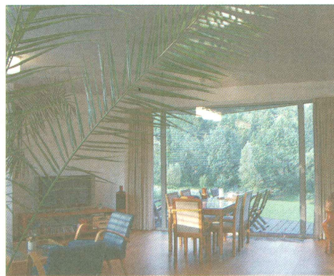
BEZ KLIK A PANTŮ. V přízemí vily se nachází volný prostor, který odděluje jednotlivé funkce, nikoli dveře. Cenu domu majitelé neuvedli.

projekt, který určil základní podobu domu, byl vypracován velmi rychle. Potíže nastaly se zastřešením. „První variantu s pultovými střechami jsme hodili do koše. Nebyla špatná, ale stavebník za rok spolupráce ztratil obavy z ploché střechy,“ popisuje architekt „porodní komplikace“. Takle rozhodně nebyla na škodu – varianta s rovnou střechou je levnější a tvarově čistší. Svůj háček však mělo i hledání uspokojivé orientace domu. Největší přednost parcely, krásný výhled, se totiž nachází severním směrem, zatímco proslunění přichází z jihozápadu. Dispozice tak byly pro architekta tvrdým oříškem. „Hlavnímu obytnému prostoru dominuje velká prosklená stěna s průhledem do krajiny na severovýchodní fasádě. Ze západu pouští do domu hřejivé sluneční paprsky horizontální prosklení přes celou západní fasádu,“ vysvětluje autor návrhu.