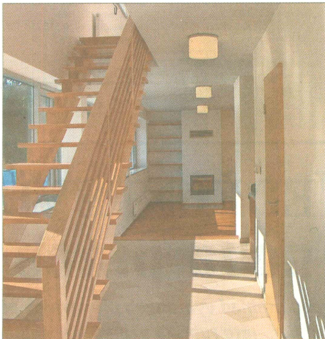
UMĚLÉ I PŘIROZENÉ. Správná kombinace denního světla s osvětlením vytváří útulnou atmosféru, aniž by bolely oči.

Světlo, ať už přirozené nebo umělé, hraje v obývacích pokojích důležitou roli. Čím více činnosti v této místnosti provozujete, tím pružnější by osvětlení mělo být. Základem je dobré celkové osvětlení doplněné o jednoduchá pracovní světla. Ať už jde o lampu či bodová, nástěnná a závěsná svítidla, všechna by měla být vybavena vypínačem s reostatem. Pokud vytvoříte hned několik různých obvodů světél s vlastním vypínačem a reostatem, budete si moci vybrat, která světla ztlumíte. Dobré je také pamatovat na to, že světlé stěny světlo odrážejí a tmavé pohlcují. Totéž platí i o povrchu nábytku. Na světlých plochách proto raději nepoužívejte žárovky s příliš velkým výkonem. Vytvořili byste obrovský reflektor. ■